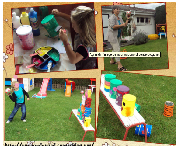
Chamboule Tout avec des boites en fer

Utiliser du papier journal ou des rouleaux de papier toilette pour fabriquer une couronne selon la période de fêtes !!