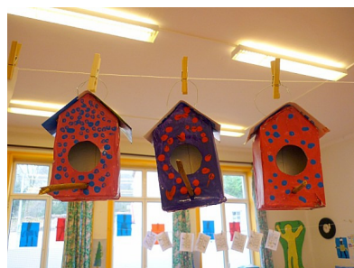
Fabriquer une mangeoire avec une brique de lait