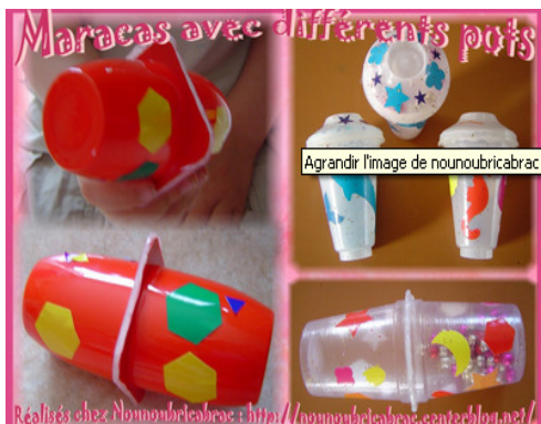
Fabrication de Maracas

Récupérer les pots de yaourt pour fabriquer des figurines sur le thème de Pâques ou autre.